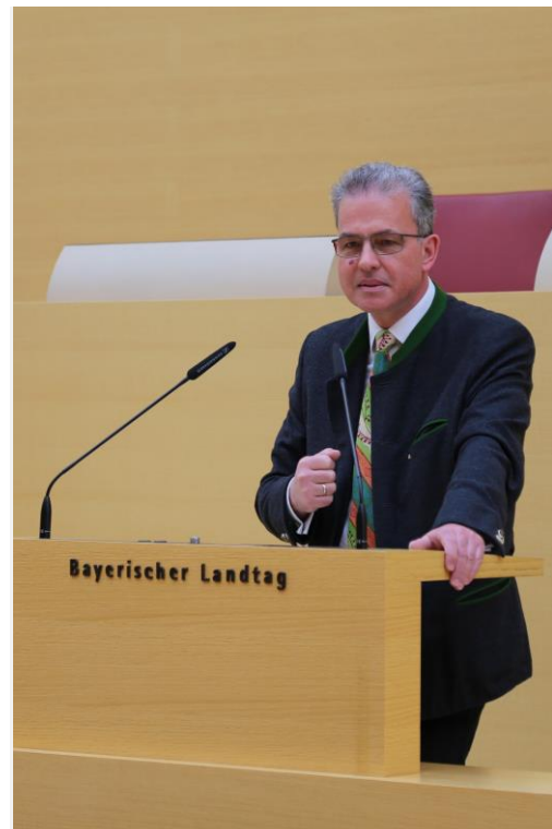
Florian Streibl MdL Fraktionsvorsitzender

neben dem unfassbaren menschlichen Leid verschärft der russische Angriffskrieg auch wirtschaftliche Unsicherheiten. Die globalen Folgen sind nur schwer abzuschätzen: Rohstoffpreise auf Rekordhöhe, gestörte Lieferketten und drohende Engpässe bei der Energieversorgung. Insbesondere die Auswirkungen der Energiekrise sind auch hier in Bayern spürbar: Gesundheitseinrichtungen, Krankenhäuser sowie Rehabilitations- und Pflegeeinrichtungen stehen vor nie dagewesenen Herausforderungen. In der aktuellen Debatte über Soforthilfen für Gesundheitseinrichtungen fordern wir FREIE WÄHLER im Landtag daher eine Energiekostenzulage für Kliniken und Praxen, damit in unseren Gesundheitseinrichtungen nicht