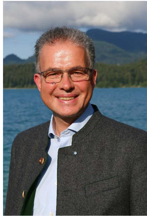
Florian Streibl, MdL Fraktionsvorsitzender

Projekte mit kulturellem Schwerpunkt bayernweit fördern: Das ist Ziel des Kulturfonds, Bereich Bildung , der diese Woche im Landtag beschlossen wurde. Im Jahr 2022 nimmt der Freistaat über 750.000 Euro in die Hand, um eine große Bandbreite an Projekten zu unterstützen – angefangen vom Seniorenstudium über Ehrenamtsarbeit bis hin zu außerordentlichen Projekten für Schülerinnen und Schüler aus den Bereichen Kunst und Kultur. Das Fördergebiet umfasst den gesamten Freistaat, vorrangig unterstützt werden jedoch örtliche Initiativen außerhalb der Ballungszentren, ganz im Zeichen von regionaler Vielfalt, Dezentralität und Subsidiarität. Gute