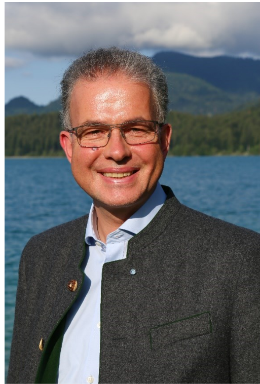
Florian Streibl, MdL Fraktionsvorsitzender

diese Woche hat unsere Staatsregierung weitere Lockerungen verkündet: Bildungskurse, Freibäder, Fitnessstudios, Kinos und Theater öffnen im Laufe der Pfingstferien. Nach und nach kehrt eine neue Normalität ein – in welcher der Gesundheitsschutz nach wie vor an oberster Stelle steht. Wir FREIEN WÄHLER blicken gleichzeitig auf die Zeit nach Corona: Wie können wir Bayern fit für die Zukunft machen, um künftigen Krisen noch besser zu begegnen? Eine äußerst wichtige Frage, die wir in der Aktuellen Stunde zum Thema „ Lehren aus Corona: Krise meistern – Zukunft sichern! “ im Bayerischen Landtag thematisiert haben.