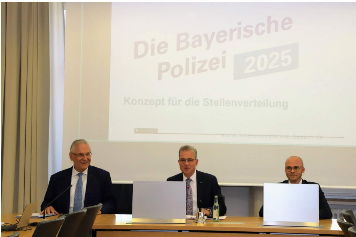
Staatsminister Herrmann zu Besuch in der Fraktionssitzung

schnittlichen kombinierten Steuersatz von mehr als 30 Prozent für Kapitalgesellschaften weist die Bundesrepublik im Vergleich zu anderen EU-Staaten sowie einer Vielzahl von OECD-Ländern einen der höchsten Unternehmenssteuersätze auf. Daher ist es höchste Zeit für eine nachhaltige und umfassende Unternehmenssteuerreform. Zusätzlich wollen wir die Binnenkonjunktur auch durch eine schnelle und vollständige Abschaffung des Solidaritätszuschlags ankurbeln, denn in Krisenzeiten bedarf es einer allgemeinen und schnellen Entlastung aller Arbeitnehmer. Ferner sollten das Außensteuerrecht modernisiert und Verbesserungen bei Verlustrechnung und Abschreibungsbedingungen erzielt werden. „Je schneller Wirtschaftsgüter abgeschrieben werden können, desto niedriger ist die steuerliche Bemessungsgrundlage. Der damit einhergehende Liquiditätsvorteil kann dann für Investitionen genutzt werden.“